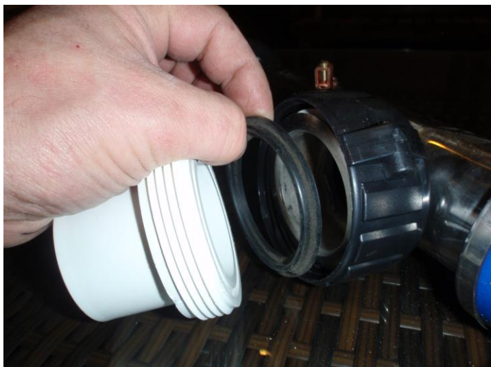
Illustrerer pakning på et varmeelement

Hvis det er stengeventil på hver side av flenskobling, kan stengeventil stenges før man skrur opp kobling og sjekke at pakning er ok, ligger i rett posisjon. Hvis det ikke er stengeventil må man tappe ned vannivå i badet før man åpner flenskobling.