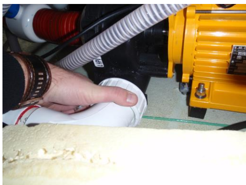
Trykksiden av vannhus.